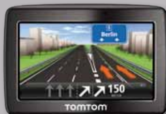
Navigationssystem TomTom „VIA 125 Europa Traffic“