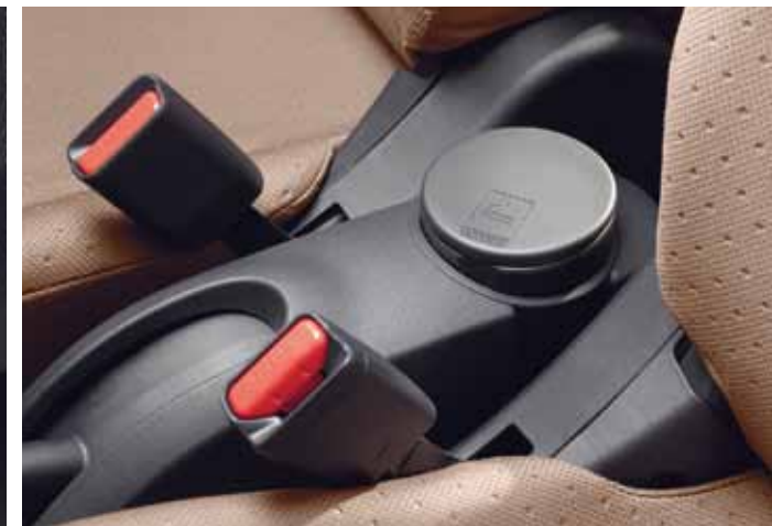
Aschenbecher Bestell-Nr.: 962395 Passender Halter für Aschenbecher – Bestell-Nr.: 962396