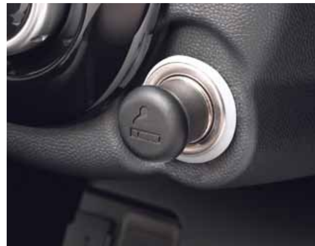
Zigarettenanzünder Bestell-Nr.: 9425E9