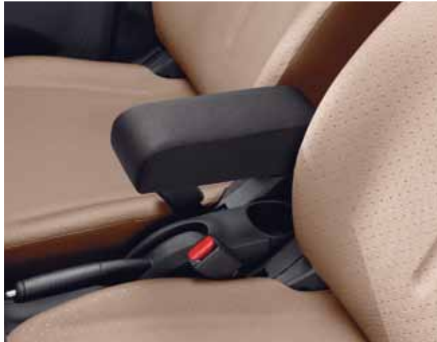
Mittelarmlehne Bestell-Nr.: 944020