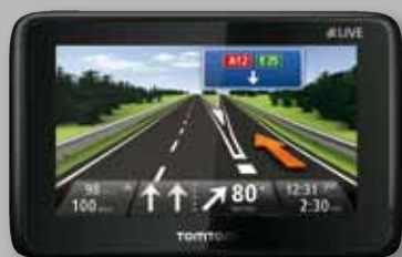
Navigationssystem TomTom „GO LIVE 1000 Europe“