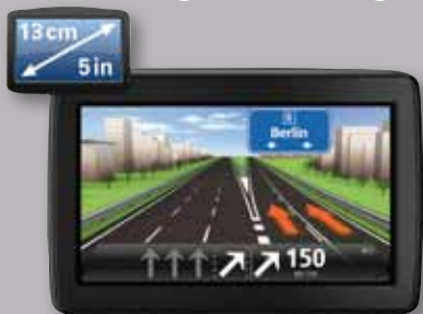
Navigationssystem TomTom „Start 25 EU Traffic“

Bitte informieren Sie sich bei Ihrem CITROËN Partner und lassen Sie sich das aktuelle Angebot an Navigationssystemen vorstellen.