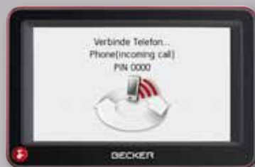
Navigationssystem Becker „Active 43 Talk“