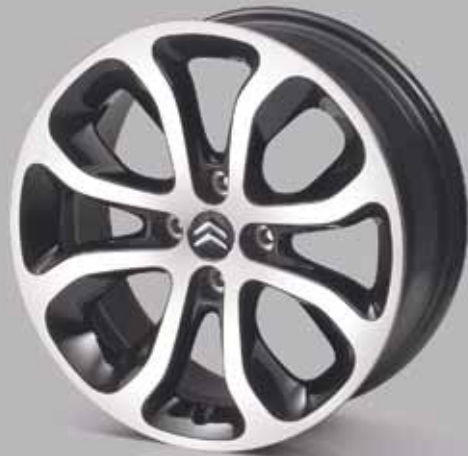
Leichtmetall-Felge „Clover“ (1)

Die Original-Leichtmetallfelgen betonen den starken Auftritt des CITROËN C3 Picasso und geben ihm einen ganz individuellen Charakter. Optimal auf das Fahrverhalten abgestimmt, erfüllen sie höchste Sicherheitsanforderungen. In puncto Felgendesign und Radnabenabdeckung wird die Wahl dabei zur echten Typfrage. Wobei eines klar ist: Ihr CITROËN C3 Picasso wird ausgezeichnet dastehen.