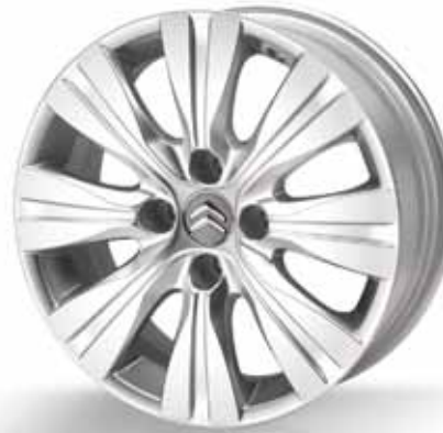
Leichtmetall-Felge „Blade“ (1)

Satz zu 4 Stück, Größe 7 x 17, Diamant-Schwarz – poliert Bestell-Nr.: 540711