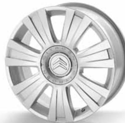
Leichtmetall-Felge „Amirantes“ (1)