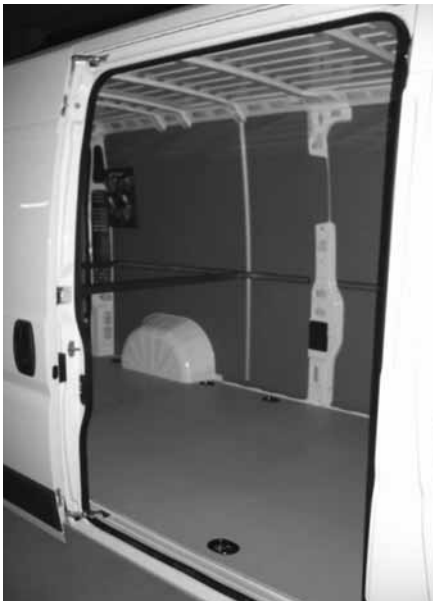
Seitenansicht Laderaumschutz mit Spannstangen, Einstiegleiste und Zurrgurttasche