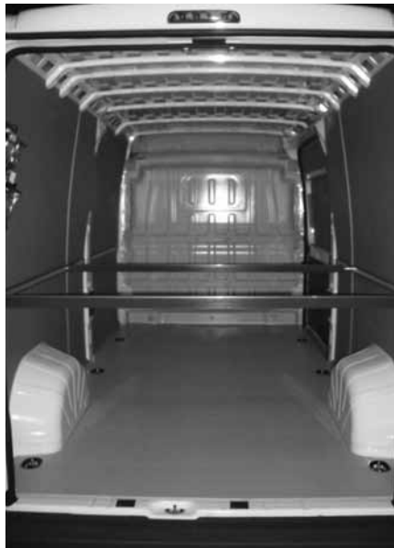
Heckansicht Laderaumschutz mit Spannstangen und Einstiegleiste