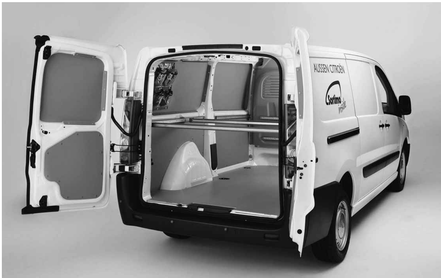
Heckansicht: Laderaumschutz mit Spannstangen und Zurringtasche