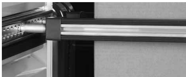
Alu-Spannstange mit Gasdruckdämpfer und Arretiermöglichkeiten