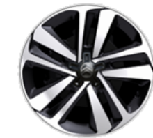
17-ZOLL LEICHTMETALLFELGE ZHJB Serie i.V.m. TYPE-H PACK