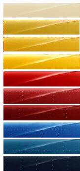
E0CC Hellelfenbein, RAL 1015 E0AS Ginster-Gelb, RAL 1032 E0BS Gold-Gelb, RAL 1004 E0DC Post-Gelb FR E01W Post-Rot GB E0JH Feuer-Rot, RAL 3000 E0X9 Ardent-Rot E0MG EDF-Blau 1987 E03L KML-Blau E04P Imperial-Blau 800,00 (952,00)