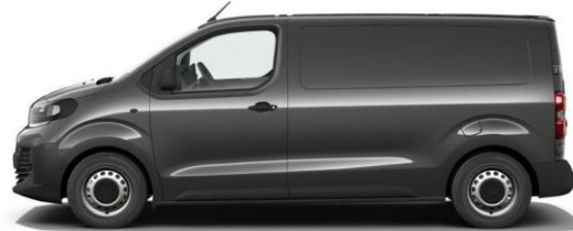
TITANIUM-GRAU M01J 600,00 (714,00)