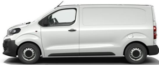
KAOLIN-WEISS POPR 0,00 (0,00)