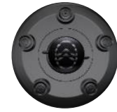
RADNABENABDECKUNG ZHYV, ZHYW, ZHZQ Serie