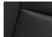
LEDER CLAUDIA CYFX Paket Luxury