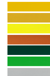
E0AS Ginster Gelb RAL 1032 (DHL) E0DC Post Gelb E0AL Schwefel Gelb RAL 1016 E0W8 Orange Batik Metallic E06Q Moos Grün RAL 6005 E0QT Gelbgrün RAL 6018 E0ZR Aluminium Grau Metallic

*Folgende Sonderfarben sind auf Anfrage erhältlich und werden mit 1200 Euro netto berechnet. Erkundigen Sie sich bei Ihrem Händler nach Verfügbarkeit und Lieferzeiten