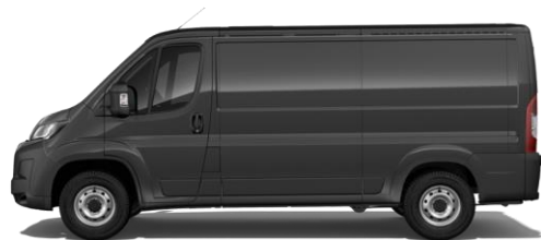
GRAPHIT GRAU M0E9 700,00 (833,00)