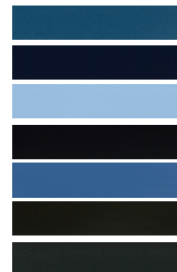
E03M Sturm Blau Metallic E04P Imperial Blau E05X Mundo Azur Blau E0CL Suggestivo Blau E0QD Fern Blau RAL 5023 E0EV UPS Braun E0VZ Schwarzgrau RAL 7021