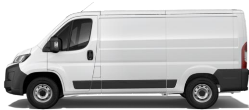
WEISS P0PR 0,00 (0,00)