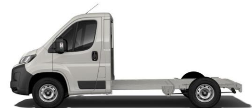
EXPEDITION GRAU P04K 350,00 (416,50)