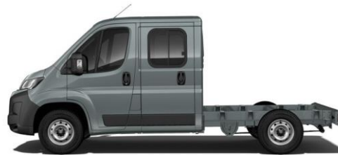
THUNDER GRAU P02B 350,00 (416,50)