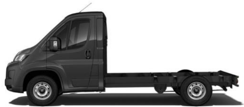
GRAPHIT GRAU M0E9 700,00 (833,00)