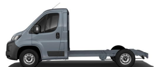
EISEN GRAU M0ZW 700,00 (833,00)