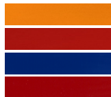
E0HS Kommunal Orange RAL 2011 E0JH Feuerwehr Rot RAL 3000 E0GC Ultramarin Blau RAL 5002 E01X Tizian Rot