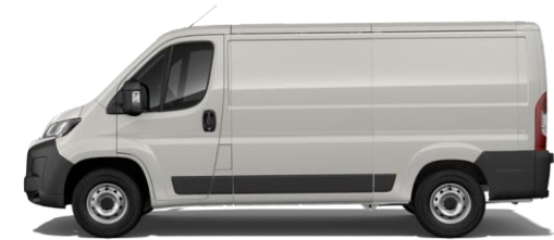
EXPEDITION GRAU P04K 350,00 (416,50)