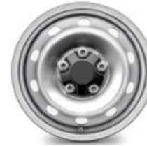
16-ZOLL-FELGEN ZIAS 0,00 (0,00)