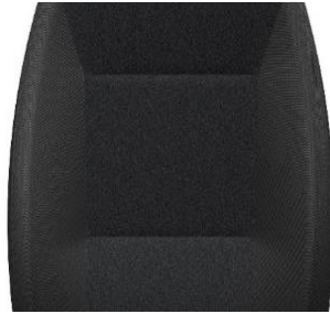
BTFX 0,00 (0,00)