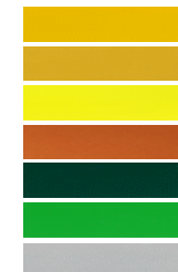
E0AS Ginster Gelb RAL 1032 (DHL) E0DC Post Gelb E0AL Schwefel Gelb RAL 1016 E0W8 Orange Batik Metallic E06Q Moos Grün RAL 6005 E0QT Gelbgrün RAL 6018 E0ZR Aluminium Grau Metallic

*Folgende Sonderfarben sind auf Anfrage erhältlich und werden mit 1200 Euro netto berechnet. Erkundigen Sie sich bei Ihrem Händler nach Verfügbarkeit und Lieferzeiten