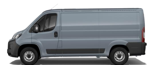
EISEN GRAU M0ZW 700,00 (833,00)