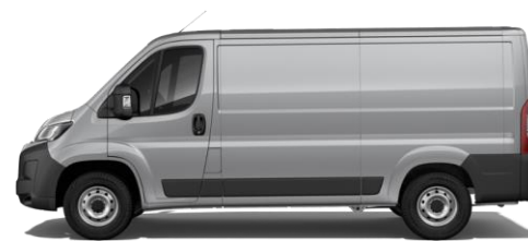
STAHL (ARTENSE) GRAU M0F4 700,00 (833,00)