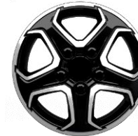
16-ZOLL-LEICHTMETALLFELGEN ZIBB 700,00 (833,00)