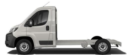
EXPEDITION GRAU P04K 350,00 (416,50)