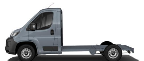
EISEN GRAU M0ZW 700,00 (833,00)