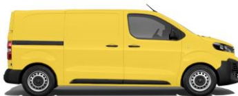
Verkehrsgelb, RAL 1023