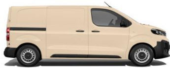
Hellelfenbein, RAL 1015