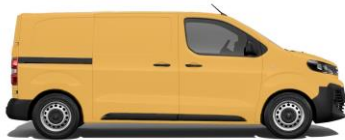
Gold-Gelb, RAL 1004