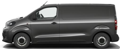
TITANIUM-GRAU M01J 650,00 (773,50) nicht i.V.m. TYPE-H