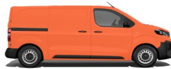
Kommunalorange, RAL 2011