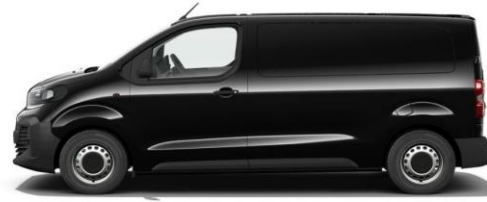
PERLA NERA-SCHWARZ M09V 650,00 (773,50) nicht i.V.m. TYPE-H