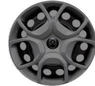
17-ZOLL-RADZIERBLENDE ZHYY Serie i.V.m. PDxx