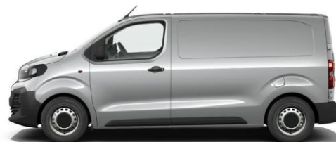
STAHL-GRAU M0F4 650,00 (773,50) nicht i.V.m. TYPE-H