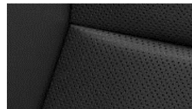
LEDER CLAUDIA CYFX Paket Luxury