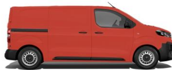
Feuer-Rot, RAL 3000