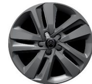
17-ZOLL LEICHTMETALLFELGE ZHJ 650,00 (773,50)