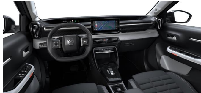
Ambiente MAX (METROPOLITAN GREY) Stoff Schwarz / Kunstleder Grau Advanced Comfort Sitze