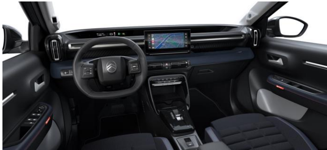
Ambiente COLLECTION (URBAN BLUE) Stoff BLAU Advanced Comfort Sitze