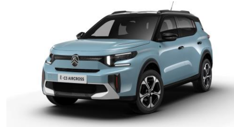
17-Zoll-Leichtmetallfelgen "Aragonit" mit Diamantschliff