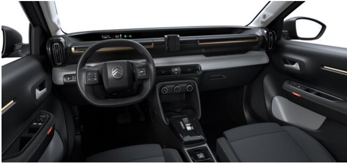
Ambiente YOU (URBAN BRONZE) Stoff Schwarz / Grau