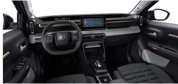
Ambiente PLUS (URBAN BRONZE) Stoff Schwarz / Stoff Grau Advanced Comfort Sitze