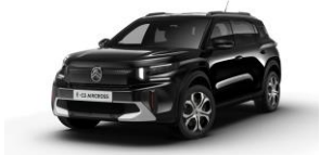
Perla Nera Schwarz (M) *