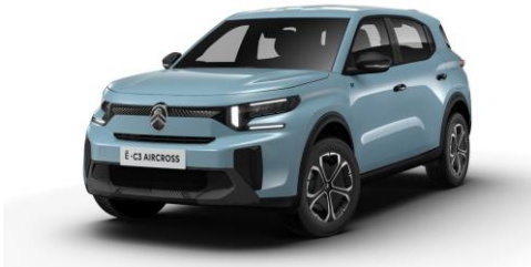
16-Zoll-Stahlfelgen mit Radzierkappen "Titanit"