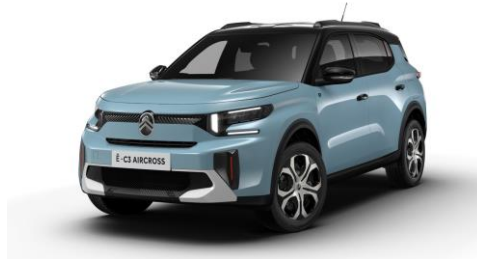
17-Zoll Stahlfelgen mit Radzierkappen Steel & Style