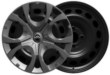
16-Zoll-Stahlfelgen mit Radzierkappen Pyrite in Mattschwarz