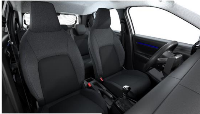
Ambiente YOU - Stoff Schwarz/Grau