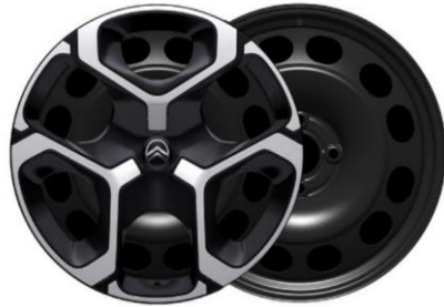
17-Zoll-Stahlfelgen mit Radzierkappen Azurite