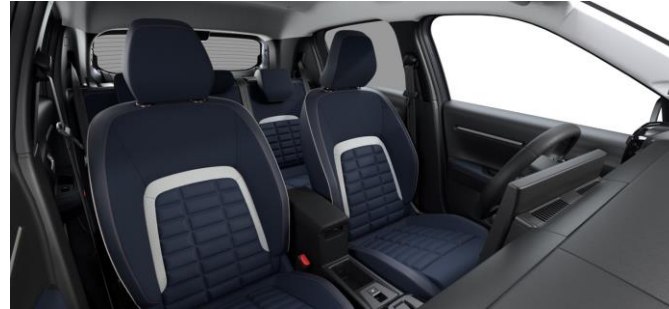
Ambiente URBAN BLUE - Stoff Urban Blau (Mittelarmlehne zwischen den vorderen Sitzen nur für Elektro/Hybrid)