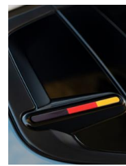
Farbclips „Team D“ Schwarz-Rot-Gold