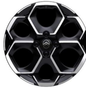
17-Zoll-Leichtmetallfelgen Atacamite mit Diamantschliff