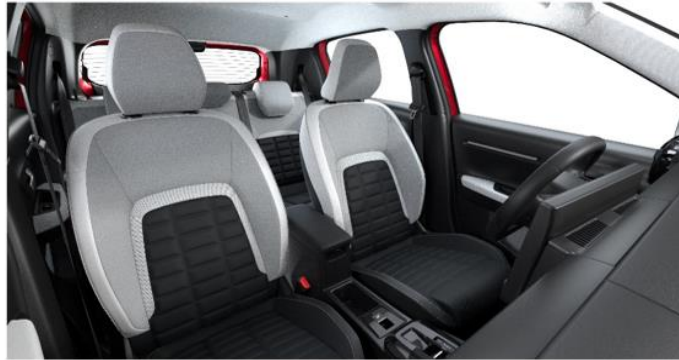
Ambiente METROPOLITAN GREY - Stoff/Kunstlederbezug Metropolitan Grey (Mittelarmlehne zwischen den vorderen Sitzen nur für Elektro/Hybrid)