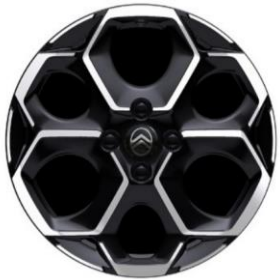
17-Zoll-Leichtmetallfelgen Atacamite mit Diamantschliff in Schwarz