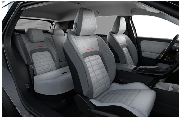
AMBIENTE HYPE GREY ADVANCED KOMFORT SITZE KUNSTLEDER- UND STOFFBEZUG IN GRAU