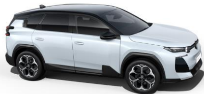
Dach in Schwarz lackiert