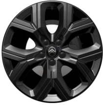
18-Zoll Leichtmetallfelgen "Carbon" nur für Hybrid