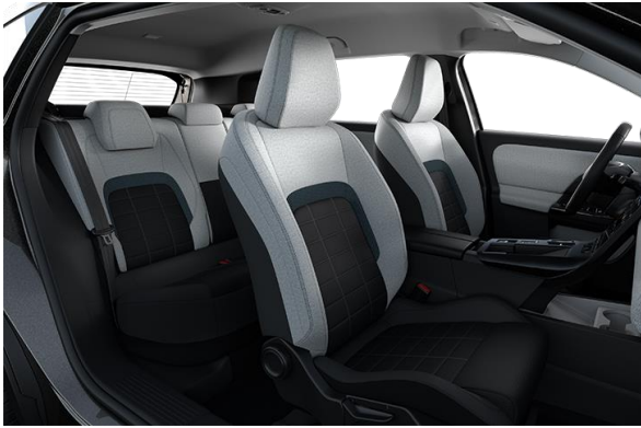
AMBIENTE YOU ADVANCED COMFORT SITZE STOFFBEZUG IN SCHWARZ UND GRAU