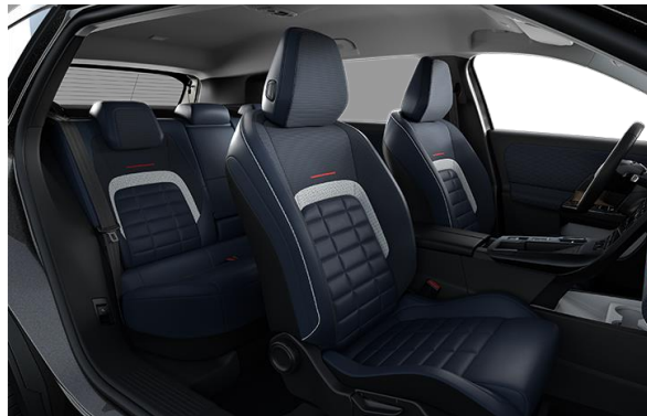
AMBIENTE YOU ADVANCED COMFORT SITZE STOFFBEZUG IN SCHWARZ UND GRAU