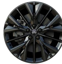
20 Zoll Leichtmetallfelgen "Obsidien" nur für Elektro / Plug-