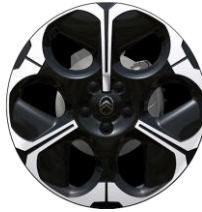
19 Zoll Leichtmetallfelgen "Moondust", hochglänzend