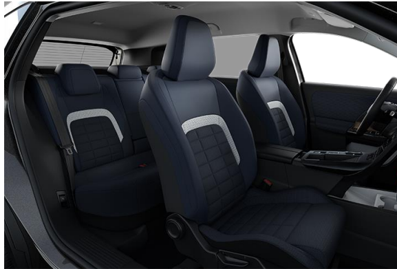
AMBIENTE URBAN BLUE ADVANCED COMFORT SITZE STOFF- UND KUNSTLEDERBEZUG IN BLAU