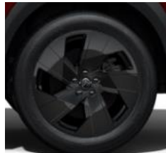
19-Zoll Leichtmetallfelgen "Zirkon" nur für Hybrid