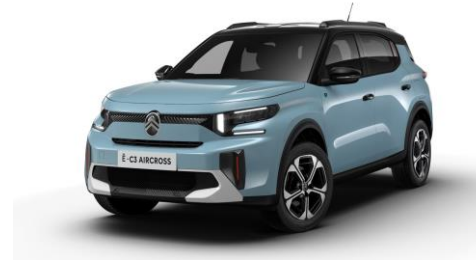
17-Zoll-Leichtmetallfelgen "Aragonit" mit Diamantschliff