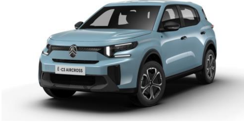
16-Zoll-Stahlfelgen mit Radzierkappen "Titanit"