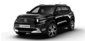
Perla Nera Schwarz (M) *