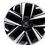
17-Zoll-Leichtmetallfelge mit Ganzjahresreifen