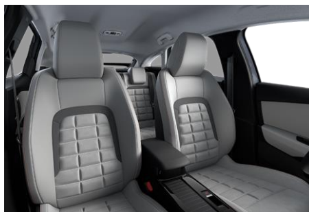
AMBIENTE HYPE GRAU ALCANTARA / KUNSTLEDER IN GRAU ADVANCED COMFORT SITZE