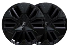
18-Zoll-Leichtmetallfelgen "Amber" in Schwarz