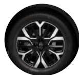
18-Zoll-Leichtmetallfelgen "Amber" glanzgedreht