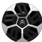
18-Zoll-Stahlfelgen mit Radzierkappen "Aerotech"