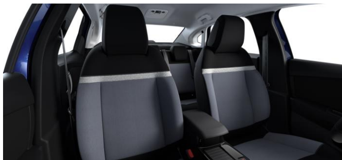
SERIENMÄSSIG STOFF "MEANWHILE" in GRAU / SCHWARZ