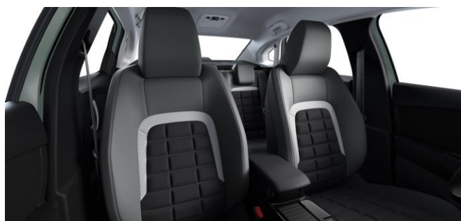
AMBIENTE URBAN GRAU - STOFF / KUNSTLEDER IN SCHWARZ / GRAU ADVANCED COMFORT SITZE