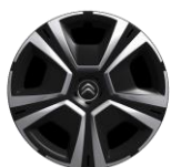
16-Zoll-Stahlfelgen mit Radzierkappen "Steel & Style"