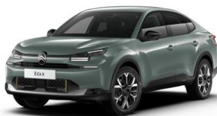
Farb-Clips "GOLD SATIN"

- Dekoreinsatz seitlicher Airbump® und Frontschürze)