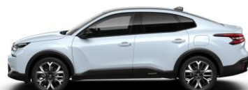
DACH IN DER FARBE SCHWARZ LACKIERT