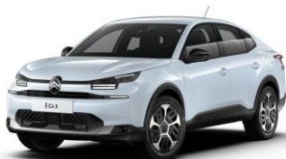
Farb-Clips "PURE BLACK"

- Dekoreinsatz seitlicher Airbump® und Frontschürze)