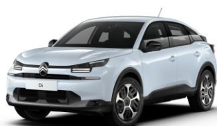
Farb-Clips "PURE BLACK"

- Dekoreinsatz Seitenschutzleisten und Frontschürze)