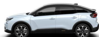
DACH IN DER FARBE SCHWARZ LACKIERT