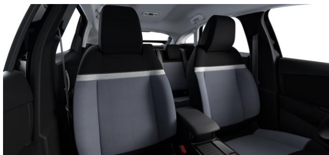
SERIENMÄSSIG STOFF "MEANWHILE" in GRAU/SCHWARZ