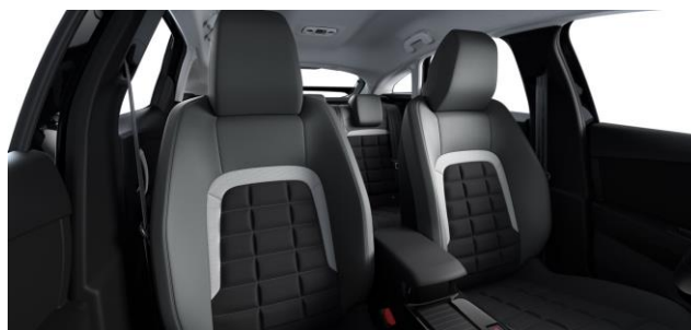
AMBIENTE URBAN GRAU - STOFF / Kunstleder in SCHWARZ/GRAU ADVANCED COMFORT SITZE