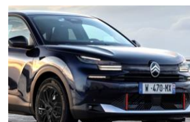
Farb-Clips "ANDRÉ ROT"

- Dekoreinsatz Seitenschutzleisten und Frontschürze)