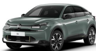
Farb-Clips "GOLD SATIN"

- Dekoreinsatz Seitenschutzleisten und Frontschürze)