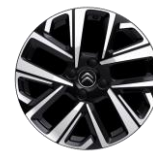
18-Zoll-Stahlfelgen mit Radzierkappen "Aerotech"