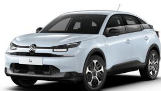
Farb-Clips "PURE BLACK"

- Dekoreinsatz Seitenschutzleisten und Frontschürze)