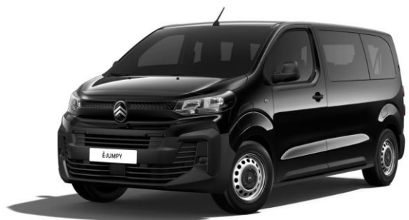
PERLA NERA-SCHWARZ (M)