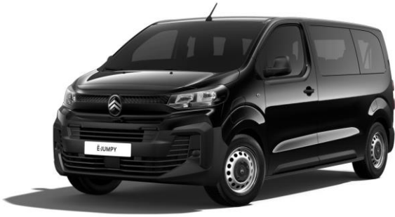
PERLA NERA-SCHWARZ (M)