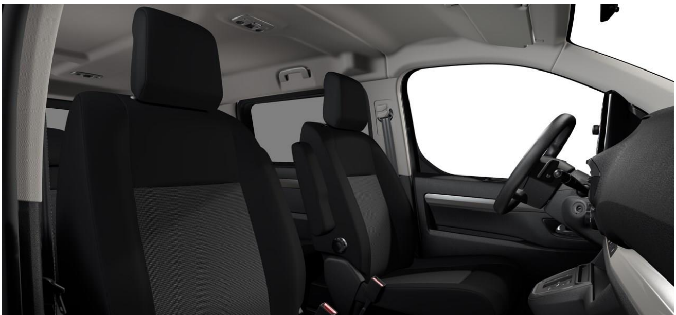
STOFF CURITIBA BLACK