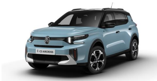
17-Zoll-Leichtmetallfelgen "Aragonit" mit Diamantschliff