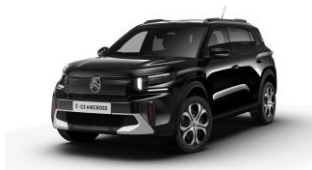
Perla Nera Schwarz (M)