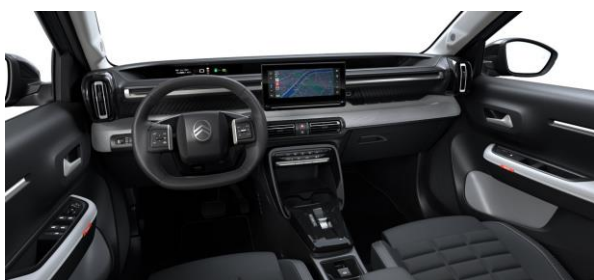
Ambiente MAX (METROPOLITAN GREY) Stoff Schwarz "Hello Knit" / Kunstleder Hell-Grau Advanced Comfort Sitze (Optional für PLUS)