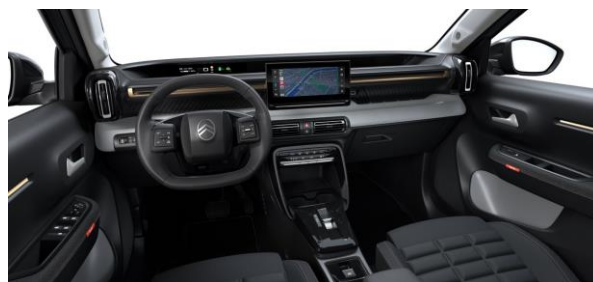
Ambiente PLUS (Urban Bronze) Stoff Schwarz / Stoff Quadric Advanced Comfort Sitze