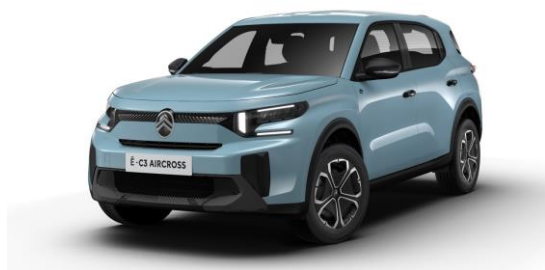
16-Zoll-Stahlfelgen mit Radzierkappen "Titanit"