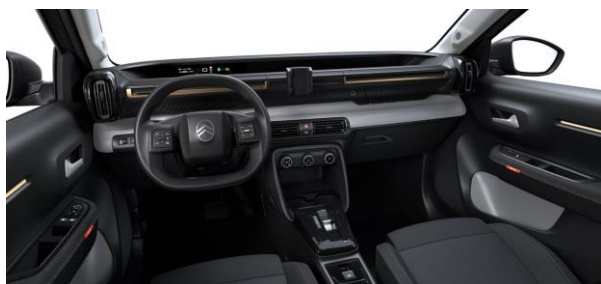
Ambiente YOU (Urban Bronze) Stoff Schwarz / Stoff Quadric