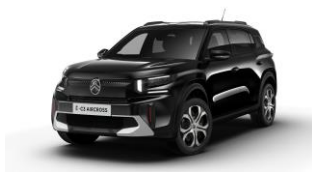
Perla Nera Schwarz (M)