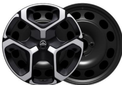
17-Zoll-Stahlfelgen mit Radzierkappen Azurite