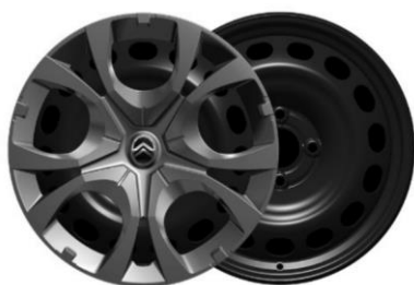
16-Zoll-Stahlfelgen mit Radzierkappen Pyrite in Mattschwarz