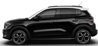
Perla Nera Schwarz (M)