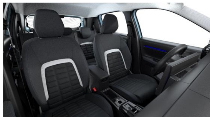
Ambiente URBAN GREY - Stoff Urban Schwarz/Grau (Mittelarmlehne zwischen den vorderen Sitzen nur für Elektro/Hybrid)