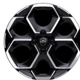
17-Zoll-Leichtmetallfelgen Atacamite mit Diamantschliff