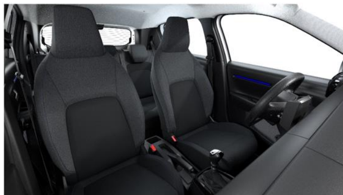
Ambiente YOU - Stoff Schwarz/Grau