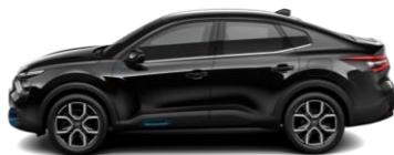
PERLA NERA-SCHWARZ (M)