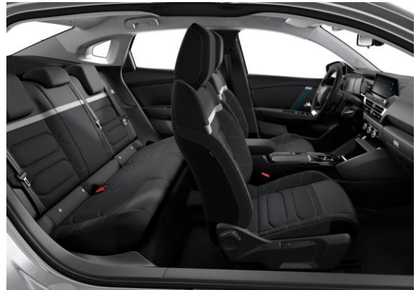
AMBIENTE URABN GREY