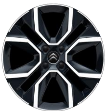
18-Zoll-Leichtmetallfelgen „CROSSLIGHT“ glanzgedreht