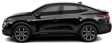
PERLA NERA-SCHWARZ (M)