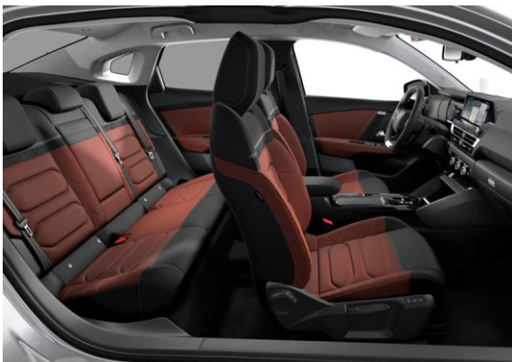
AMBIENTE HYPE RED