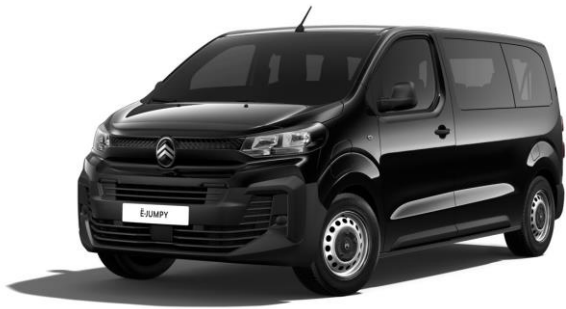
PERLA NERA-SCHWARZ (M)