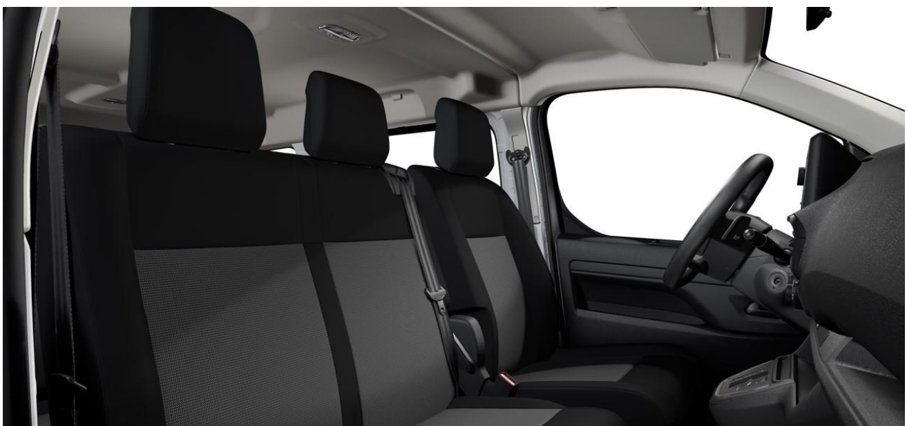
STOFF CURITIBA TRITON