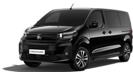
PERLA NERA-SCHWARZ (M)