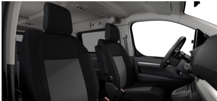
STOFF CURITIBA TRITON