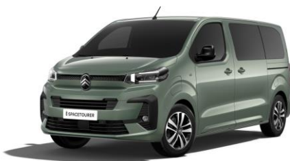
ALL TERRAIN-GRÜN (M)