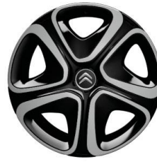
16-Zoll-Stahlfelgen mit 3D-Design-Radzierkappen