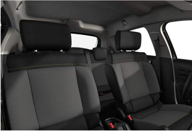
STOFF "MICA" GREY