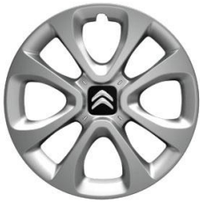
15-Zoll-Stahlfelgen mit Radzierkappen ARROW