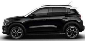
Perla Nera Schwarz (M)