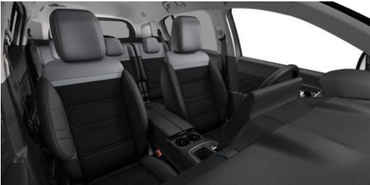
AMBIENTE METROPOLITAN GREY