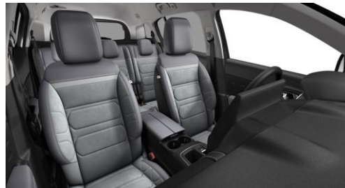
AMBIENTE Alcantara & Kunstleder GREY