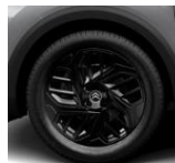
18-Zoll-Leichtmetallfelgen "Aeroblade" in Schwarz