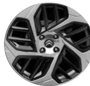
18-Zoll-Leichtmetallfelgen "Aeroblade" Anthra Grau