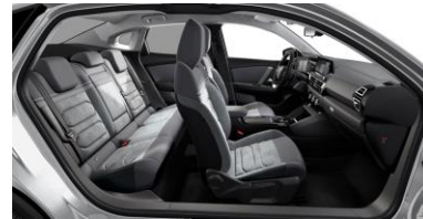
AMBIENTE ALCANTARA UND KUNSTLEDER GREY