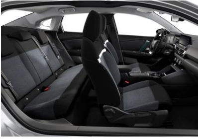
AMBIENTE "MEANWHILE" SCHWARZ