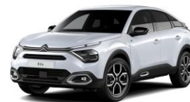
COLOR-PAKET "Glossy Silver"

- Airbump® und Nebelscheinwerfer mit schwarzer Dekorumrandung