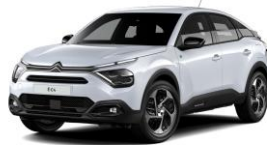
COLOR-PAKET "Glossy Black"

- Airbump® und Nebelscheinwerfer mit grauer Dekorumrandung