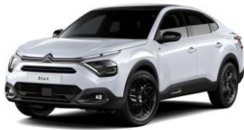
COLOR-PAKET "Turbo Grey"

- Airbump® und Nebelscheinwerfer mit grauer Dekorumrandung