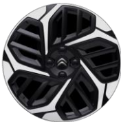
18-Zoll-Leichtmetallfelgen "Aeroblade" glanzgedreht