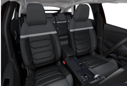
AMBIENTE METROPOLITAN GREY