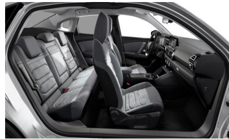
Ambiente Alcantara & Kunstleder GREY