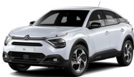
COLOR-PAKET "Glossy Black"

- Airbump® und Stoßfänger vorne mit schwarzer Dekorurandung