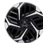
18-Zoll-Leichtmetallfelgen „AEROBLADE“ glanzgedreht