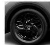
18-Zoll-Leichtmetallfelgen „AEROBLADE“ in Schwarz