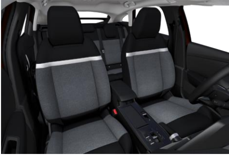
SERIENMÄSSIG STOFF "MEANWHILE"