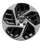
18-Zoll-Leichtmetallfelgen "Aeroblade" Anthra Grau