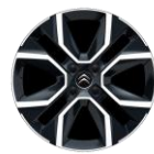
18-Zoll-Leichtmetallfelgen "Crosslight" glanzgedreht