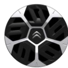
18-Zoll-Stahlfelgen mit Radzierkappen "Aerotech"