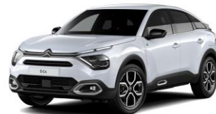
COLOR-PAKET "Glossy Silver"

- Airbump® und Stoßfänger vorne mit grauer Dekorurandung