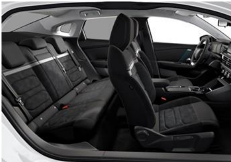
Ambiente Alcantara GREY & Kunstleder BLACK