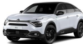
COLOR-PAKET "Turbo Grey"

- Airbump® und Stoßfänger vorne mit schwarzer Dekorurandung