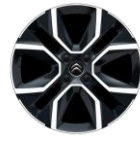
18-Zoll-Leichtmetallfelgen "Crosslight" glanzgedreht