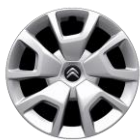
16-Zoll-Stahlfelgen mit Radzierkappen "Spring"