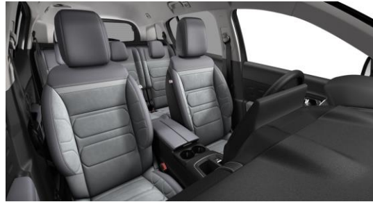
AMBIENTE Alcantara & Kunstleder GREY (ë-SERIES)