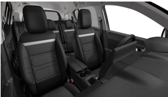
AMBIENTE METROPOLITAN BLACK