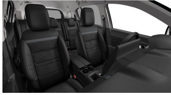
AMBIENTE URBAN BLACK