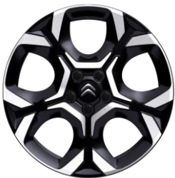
18-Zoll-Leichtmetallfelgen „Pulsar“ glanzgedreht