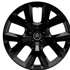
19-Zoll-Leichtmetallfelgen „Art“ in schwarz